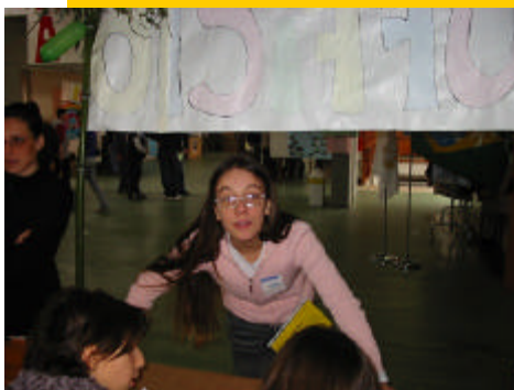
Un inviato stampa al lavoro

Quando riescono a ritagliare dalla loro giornata un po' di tempo libero, soprattutto nei giorni festivi, ai ragazzi piace molto giocare a calcio, mentre le ragazze giocano con i sassi e con i loro fratellini, oppure costruiscono aquiloni grazie al materiale che trovano nella spazzatura (li abbelliscono con quello che hanno assieme alla loro creatività e fantasia) e li fanno volare quando soffia il vento. Riescono ad accontentarsi di questi semplici passatempi e sorridono sempre alla vita che hanno!